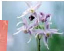
イカリソウ 海に沈めるいかりのような形にちなんで名付けられました。