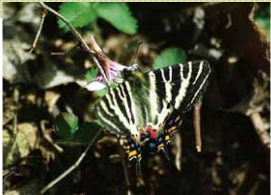
ギフチョウ 「春の女神」といわれる美しい姿のギフチョウが、春先に山頂付近で多く見られます。