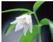
イズモコバイモ 島根県中部だけに自生するユリ科の希少植物です。