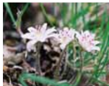
ミスミソウ 本州中部以西から九州にかけて分布する多年草です。