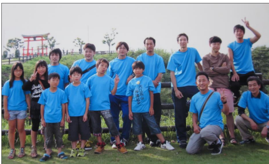
応援よろしくお願いします。

短期間での練習ではありましたが本番ではその成果を何とか発揮することができ、舞台を取り囲んだ多くのお客さまから盛んな拍手をいただくことができました。