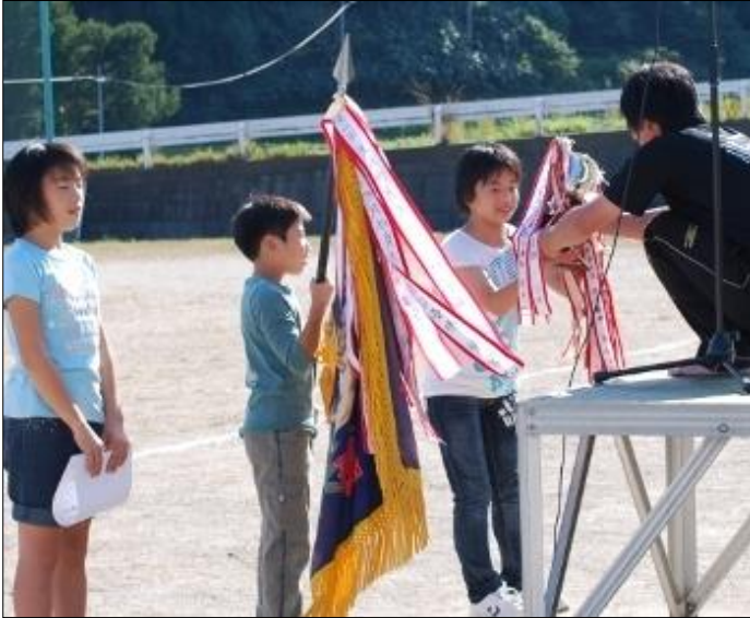
総合優勝おめでとう！水色組

10月13日、多くの町民の皆さまの参加を頂き、第63回町民運動会を盛大に開催することが出来ました。