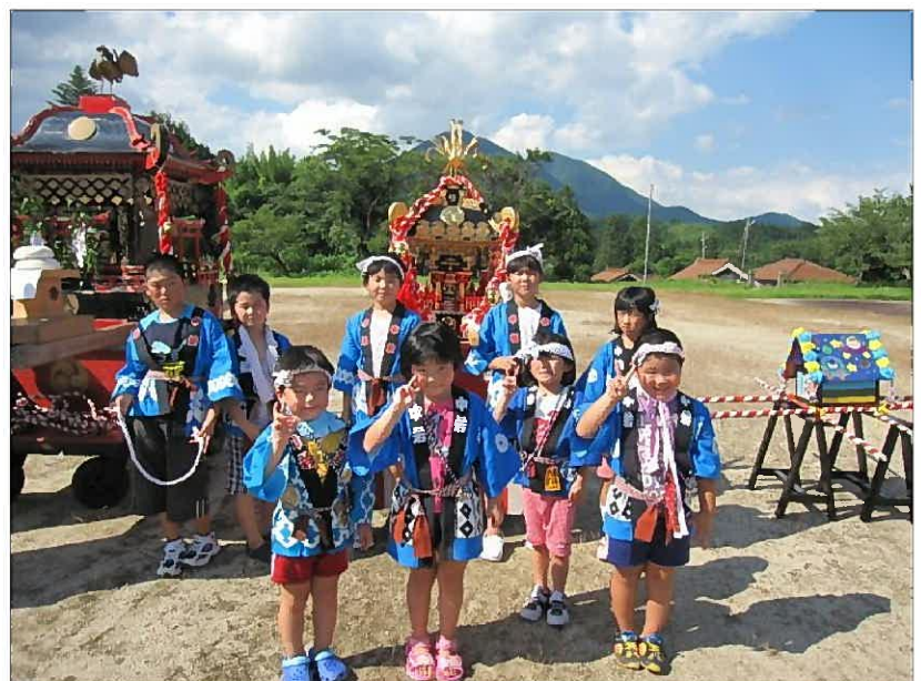
高山をバックにはい！ポーズ！