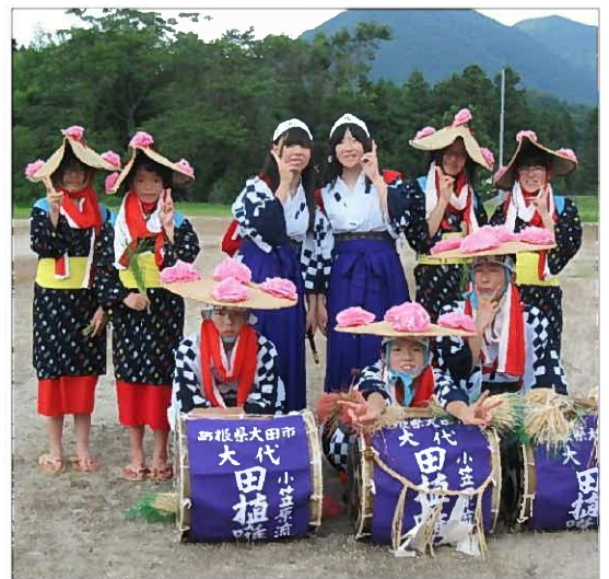
記念写真！はいポーズ！

本来ですと、御鎮座されている八幡宮横の御社で祭典を執り行なうべきですが、拝殿が狭く足場が悪いため現在では、八幡宮の拝殿を仮の齋場とし、お神輿に御霊を遷し執り行なっているところ。