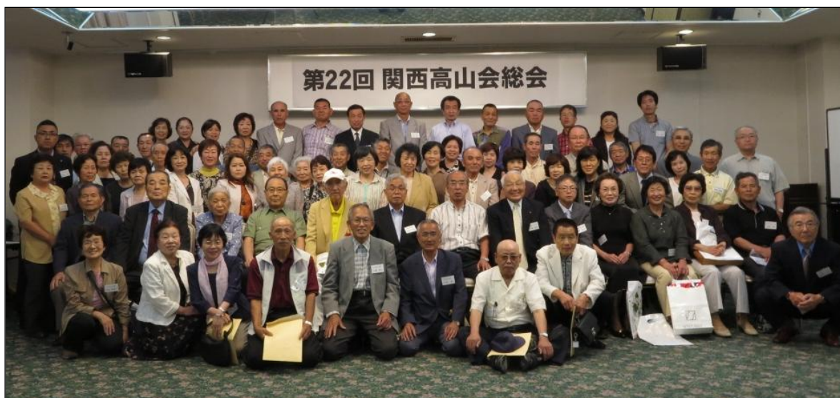
みんな 笑顔でパチリ！