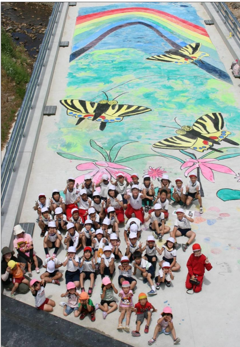
県道 31 号仁摩邑南線 「新大原橋」にて

絵のタイトルは「高山の宝物」です。このイベントを企画してくださった東幸建設の社員のみなさんや、地域の方にもお手伝いいただき、一時間かけて