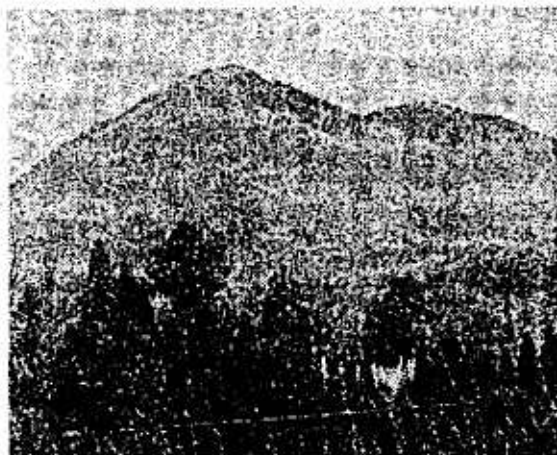
大田市大代町側から見た大江高山

尾根へ出る。さつに最後の急な登りを登り終えると、山田側のピーク(七七九)だ。冬の日本海と中国山地の大パノラマを楽しんでほしい。鳥根半島や、快晴の日には隠岐の島影さえ望むも舞う。