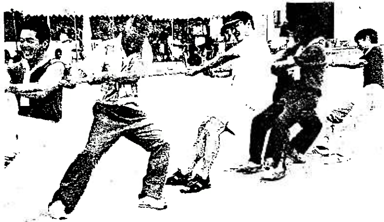
大代町民体育大会