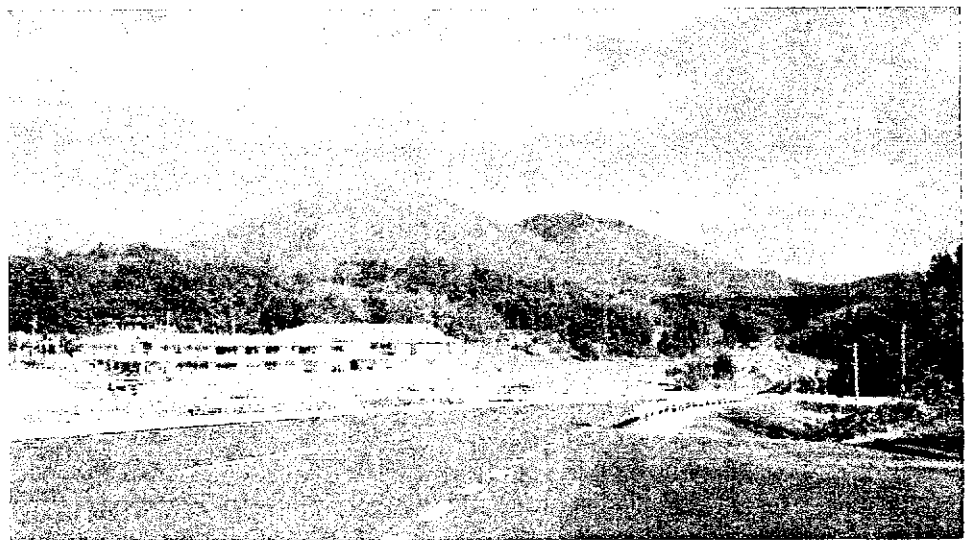
大代バイパスから眺めた大江高山と大代小学校

十二月に入り予てから期待していた大代バイパスを通る機会がやって来た。大代公民館を出て西に向かう、やがて行く手が塞がり変形三叉路になっている。ここから新しいバイパスが東に向かつて延びているのだ。