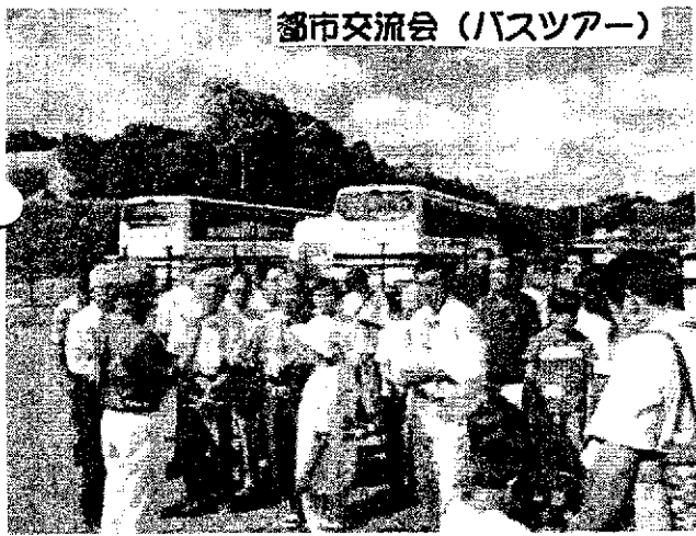
都市交流会（バスツアー）