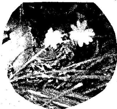
高山で見つけたミスミソウの花