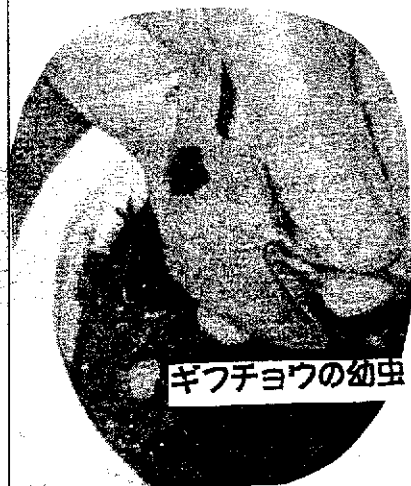
ギフチヨウの幼虫