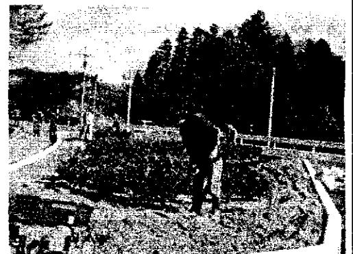
バイパス花壇の土づくり