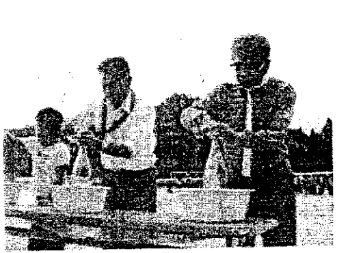
町民運動会（水入れ競争）