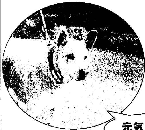
|| 我が家のペット自慢 || (弓久)