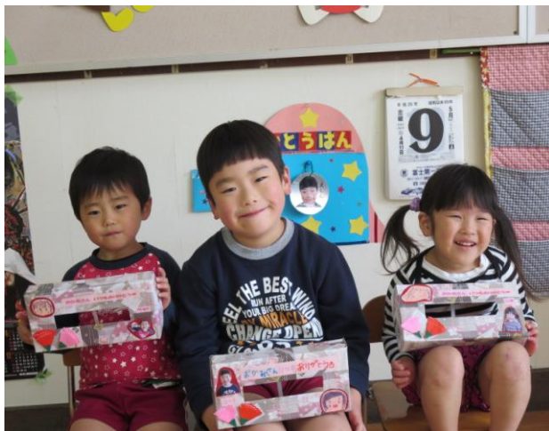
おかあさんへの手作りの プレゼントをもってパチリ！