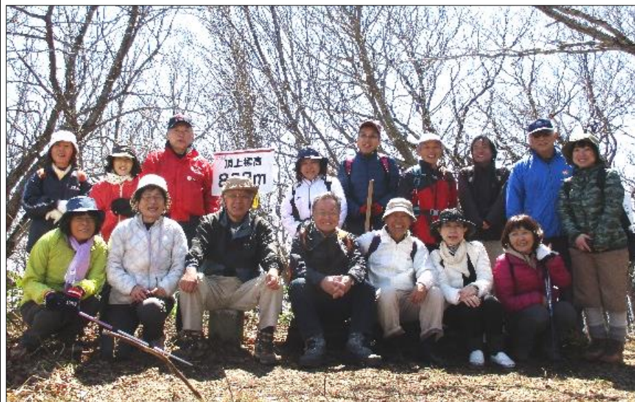
大江高山頂上にて

四月八日(日)朝、祖式から見ると江高山は何か白いもの(雪)が見えているようで、いやな感じを持ちながら山田登山口に向かいました。昨年も朝まで雨が降っており「中止」という期待もむなしく実施され、大変だったことを思い出しました。