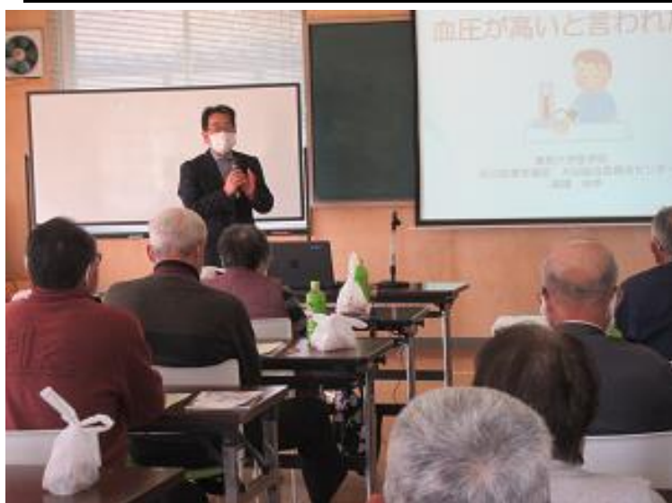
まちセンでの様子