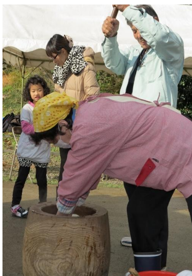
ぺったんこ！餅つきです

の皆さんが作られた豚汁・やまべのお米で握ったおにぎり等、地元ならではの馳走を堪能しました。