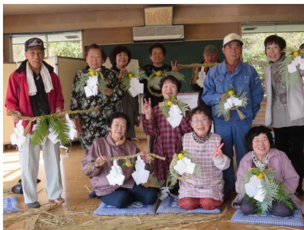
お正月に飾ります！

4日、しめ縄作りがまちセンで開催され、それぞれ個性的なお正月のしめ縄飾りが出来上がりました。