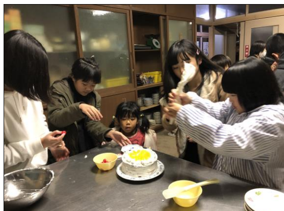
にぎやかなケーキ作り