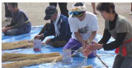
大代ならではの縄ない競争

しかし、何かと理由をつけて、運動をせずに過ぎていく日々・・・。そんな私が一年に一度、体をしっかり動かす日・・・町民運動会！！ 去年、ランニングを始めようかなと思いつき、買ったランニングシューズ。結局、新品のまま、玄関に飾ってあった。時は過ぎ・・・約一年。玄関の置物として立派に役目を果たし、いよいよ今年、土の上へデビューした私のランニングシューズ。やっと訪れた活躍の場。そんな場を与えてくれた体協さん、ありがとうございます！あやうく、ランニングシューズの使い方を間違えるところでした（笑）