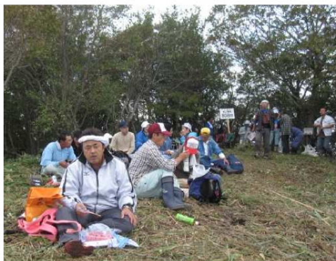
頂上にて美味しいお弁当をパクリ！

登山道は、きれいにカヤゴや雑草が刈り取られ、楽に登頂出来るようになりました。頂上では、ゆっくり弁当を広げることも出来ます。