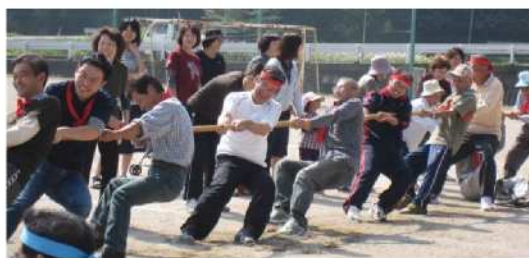
よいしょ！こらしよ！

振り返る。町民運動会は、町民が一つになって、お祭り状態で盛り上がるから、おもしろい。綱引きでハッスルし、リレーでハッスルし・・・、襲ってくる筋肉痛は半端では無い。でも、その時は、後先考えず、一生懸命！！それが楽しいんだろう・・・なんて考えてみたりする。 スポーツと言うのは、ずっと昔からあるもの。種類も豊富で、体を動かす事は健康にも良いと言われている。