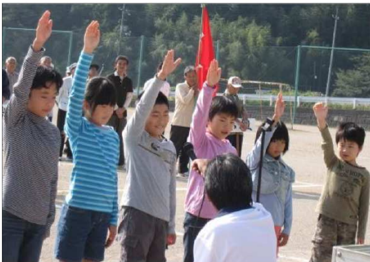
全校児童による力強くまた可愛い選手宣誓！

振り返る。町民運動会は、町民が一つになって、お祭り状態で盛り上がるから、おもしろい。綱引きでハッスルし、リレーでハッスルし・・・、襲ってくる筋肉痛は半端では無い。でも、その時は、後先考えず、一生懸命！！それが楽しいんだろう・・・なんて考えてみたりする。 スポーツと言うのは、ずっと昔からあるもの。種類も豊富で、体を動かす事は健康にも良いと言われている。