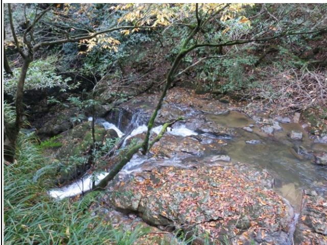
上側からみた大光院の滝