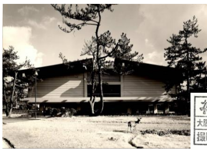
御堂スタジオ 大阪市東区本町4-15 TEL. 271-4746 撮影者 渡 幸