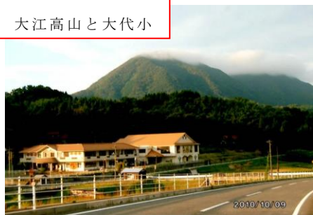
大江高山と大代小