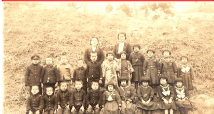
S17年 旧八代小学校1年生