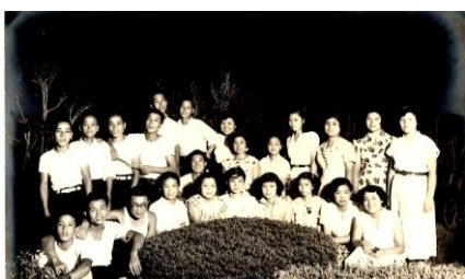
↑ 同窓会 S28年 浄土寺で