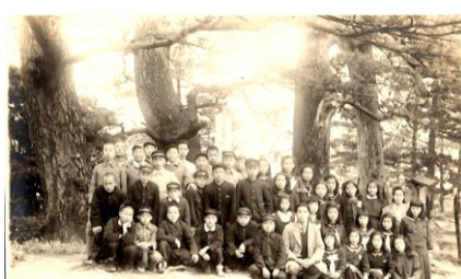
↑ 修学旅行 美保関